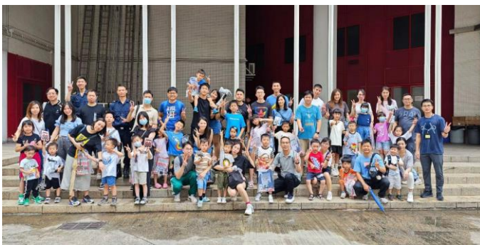
參觀消防局黑沙環行動站

在 7 月 27 日上午，來自各保安部隊及保安部門的人員及其家屬共 23 人到訪本校，透過參觀活動讓參與者更深入地認識保安高校的培訓和民防工作，促進各部門人員之間的相互了解。