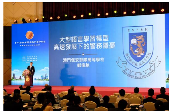
學員發表論文報告