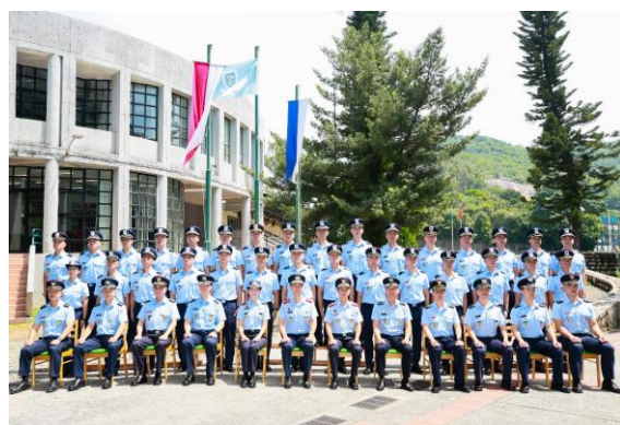
本校領導及主管與學員們合照