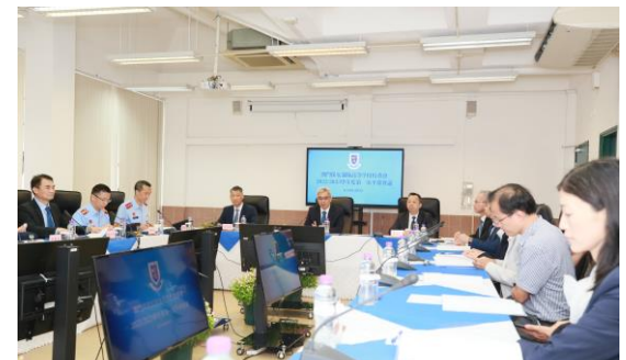
校董會成員積極發言給予寶貴意見