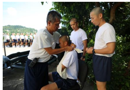
演習期間模擬受傷包紮