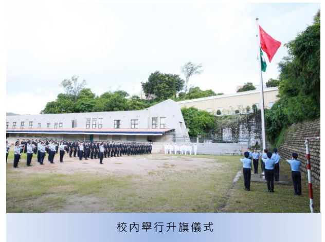
校內舉行升旗儀式

7月4日，為澳門保安部隊高等學校三十五周年校慶，於上午八時正在校內舉行升旗儀式，其後舉辦了校慶系列活動—“新型網絡犯罪的發展與挑戰”研討會；研討會的開幕儀式由保安司司長黃少澤主禮，並邀請到由中國人民公安大學副校長李守德帶領的內地公安教育代表團一行八人、由中央司法警官學院黨委副書記劉建會帶領的代表團一行五人、警察總局局長梁文昌、澳門海關關長黃文忠，以及保安範疇轄下領導和各級人員代表出席。研討會邀請到來自內地、香港及本澳的學者專家發表文章，內容涵蓋人工智能、網絡犯罪、電訊詐騙及網絡安全等多個方面；除設有現場參與外，亦在各保安部隊及保安部門設線上直播點，參與是次研討會的人數共370人。