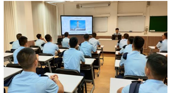
觀看烈士紀念日影片

9月30日及10月1日分別為“烈士紀念日”及“中華人民共和國國慶節”，為加深學員的愛國情懷，令學員牢記歷史，本校安排第十八屆警官/消防官培訓課程學員透過觀看相關影片，讓學員了解現今繁榮穩定的社會全賴先輩們的努力奮鬥，令其認清作為當代青年的使命和身為國民應盡的責任，從而提升學員對國家的認同感和使命感。