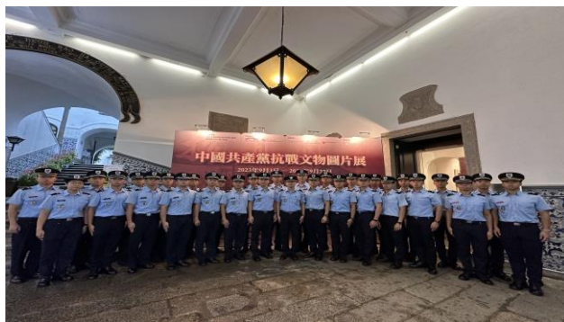
觀看中國共產黨抗戰文物圖片展

為加深學員瞭解抗日戰爭歷史，進一步傳承和弘揚中華民族偉大愛國主義精神，本校安排第十八屆警官/消防官培訓課程學員觀看中國共產黨抗戰文物圖片展，圖片展是首次以精品文物圖片為主體，全面反映中國共產黨率領人民進行艱苦卓絕的偉大鬥爭，共同回顧中國共產黨在抗戰期間發揮的中流砥柱作用，各部分內容都有相應的典型文物予以支撐，以物敘事、以物證史的方式得以圓滿呈現。