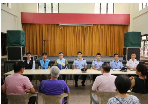
各部門代表介紹民防相關資訊

本校持續與民防架構成員緊密合作，透過舉辦相關講座和演習，提升市民的防災應急意識，提高撤離工作的執行力，切實保障市民生命和財產安全。