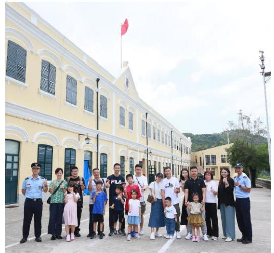
參觀澳門保安部隊高等學校