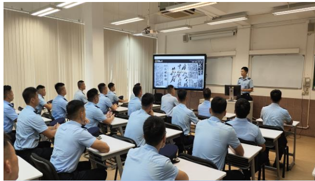
觀看中國人民抗日戰爭的相關影片

9月3日，是中國人民抗日戰爭勝利紀念日。本校安排第十八屆警官/消防官培訓課程學員於課堂中透過對中國人民抗日戰爭的介紹及播放相關影片，以提醒學員銘記中國人民反抗日本侵略，緬懷在抗日戰爭中英勇獻身的英烈和所有為抗戰勝利作出貢獻的人們，表明中國人民堅決維護國家主權、領土完整和世界和平的堅定立場。