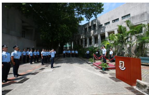
學員隊伍向校長黃子暉致敬

是次開學禮標誌著新學年的正式開始，保安高校將致力做好教育工作，持續培養高質素的人員，為保安部隊及保安部門提供專業精幹的新力量。