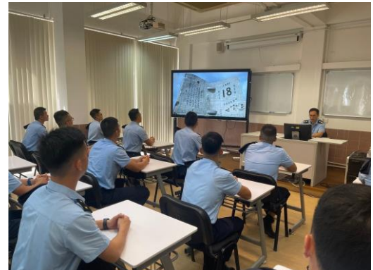
觀看“九一八事變”影片

為了讓學員認識“九一八事變”的發生原因及影響，本校於9月18日安排第十八屆警官/消防官培訓課程學員觀看“九一八事變”影片，使學員更深切體會到國家的和平穩定實在來之不易。讓學員認清作為當代青年的使命，不忘過去，珍愛和平，深刻認識捍衛國家主權和維護人民福祉的重要性。