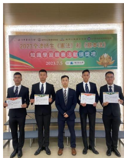
課程主管與獲獎學員合照

保安高校積極推動學員參與活動，透過是次知識競賽，提高學員對憲法和基本法的理解，培養愛國愛澳的價值觀。