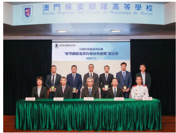
保安司司長黃少澤及官員與主講嘉賓合照