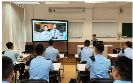
觀看慶祝教師節的影片

為弘揚尊師重道的精神，於 9 月 7 日本校安排學員觀看 2023 年慶祝教師節宣傳短片及教師節電視特輯“沿途有您 XI”，以及參與教師節專題網頁“沿途有您——謝謝老師！”