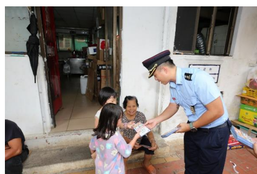
向市民派發民防宣傳單張