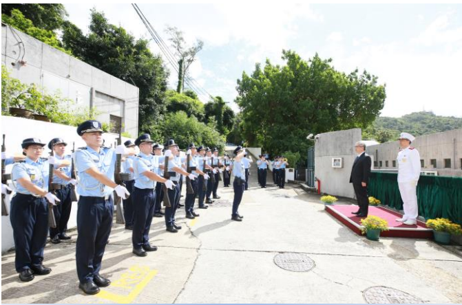
保安司司長黃少澤接受儀仗隊致敬

通過研討會，讓與會者對當前新型網絡犯罪形勢加深了認識，有助提升警務人員打擊罪案的能力，以及面對日新月異的挑戰，並體現本校作為保安部隊及保安部門培訓基地的承擔，不斷探索新時代下社會治安防控策略，為複雜多變的警務工作提供應對方法。