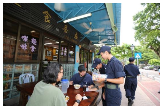
向市民呼籲做好防風措施

本校冀透過主動深入社區，強化居民的防災及應急意識，提高撤離工作的執行力，減低颱風對低窪地區居民及商戶所帶來的影響。