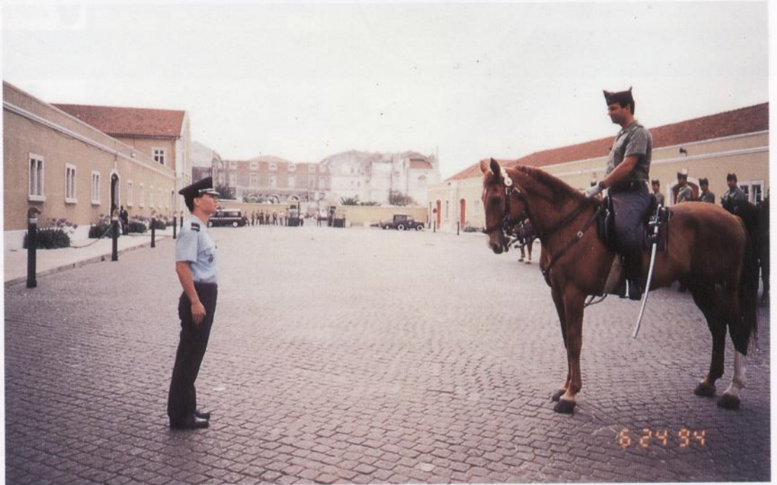
參觀國民警衛軍騎兵團

即使沒有豐富的訪問行程，又或即使沒有令人心醉的觀光節目，仍覺此行不虛，因為我們已得到了人生旅途中最寶貴的東西——無價的友誼及最熱情的款待。事實上，啟程前吾胞妹已多次向我提及葡萄牙民族的熱情和好客，沒想到其所描述的竟不及我們所遇之萬一，致令我