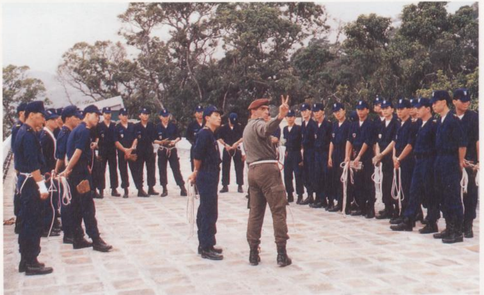
訓練員應懂得保持班內的學習意欲

他必須懂得如何去瞭解學員，在一些能引致不安、氣餒、痛楚等感覺的訓練情況中，懂得如何激勵學員，如何誘導學員