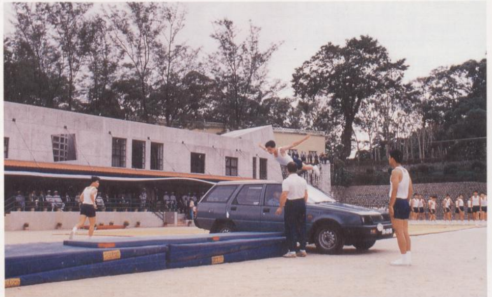
訓練員應明瞭教學內容及在適當時候作出參與

去消除由某些較危險的練習所帶來的壓力，令他們能透過冷靜及自我控制去克服這些障礙。此外，必須懂得如何指引學員去進行活動，而訓練員應該從整體而不是循環一角度去考慮他們作為學生時的人性實質。