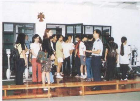
行政、教育及安全委員會到本校參觀

立法會之行政、教育及安全委員會於五月二十七日參觀了澳門保安部隊以及澳門保安高校。