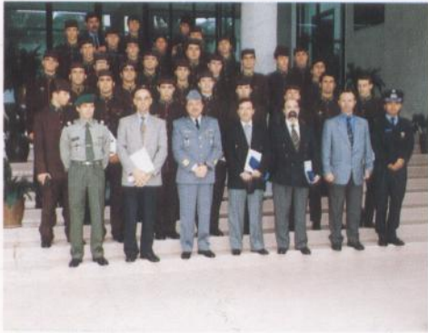
軍事學院九七年度畢業生——三月二十二日至二十九日

葡國軍事學院以及警察高等學校的屆畢業生分別於三月二十二日至二十九日以及四月一日至九日訪澳。在留澳期間，上述院校學生皆下榻於澳門保安高校。