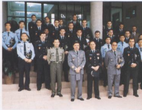
警察高等學校九七年度畢業生——四月一日至九日