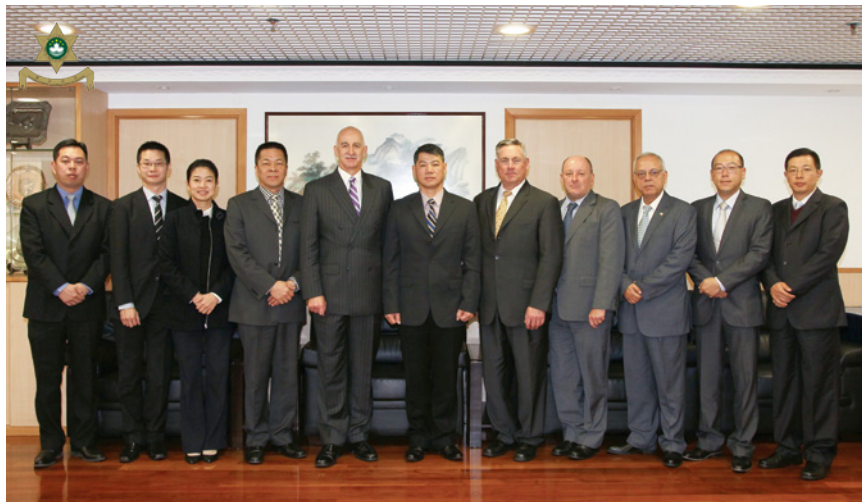
Fornecer ao sector hoteleiro as sugestões e medidas para prevenção de crimes

Durante os meses de Janeiro e de Março, esta Corporação efectuou encontros com os representantes do sector logístico e de segurança de “ Studio City Macau ”, os representantes de “ Grand Coloane Resort ”, de “ MGM Grand Paradise Ltd ” e de “ United International Property Management Co., Ltd ”, com o intuito de elevar a consciência de segurança industrial, de trocar as opiniões acerca de segurança, de trânsito rodoviário, do tratamento de objectos perdidos pelas turistas e de combater os trabalhadores ilegais e pensões ilegais, bem como através do reforço de cooperação entre Polícia e cidadãos para prevenir e combater a criminalidade.