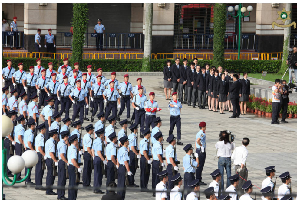
As Forças em Parada dirigiram o içar da Bandeira Nacional e da Região