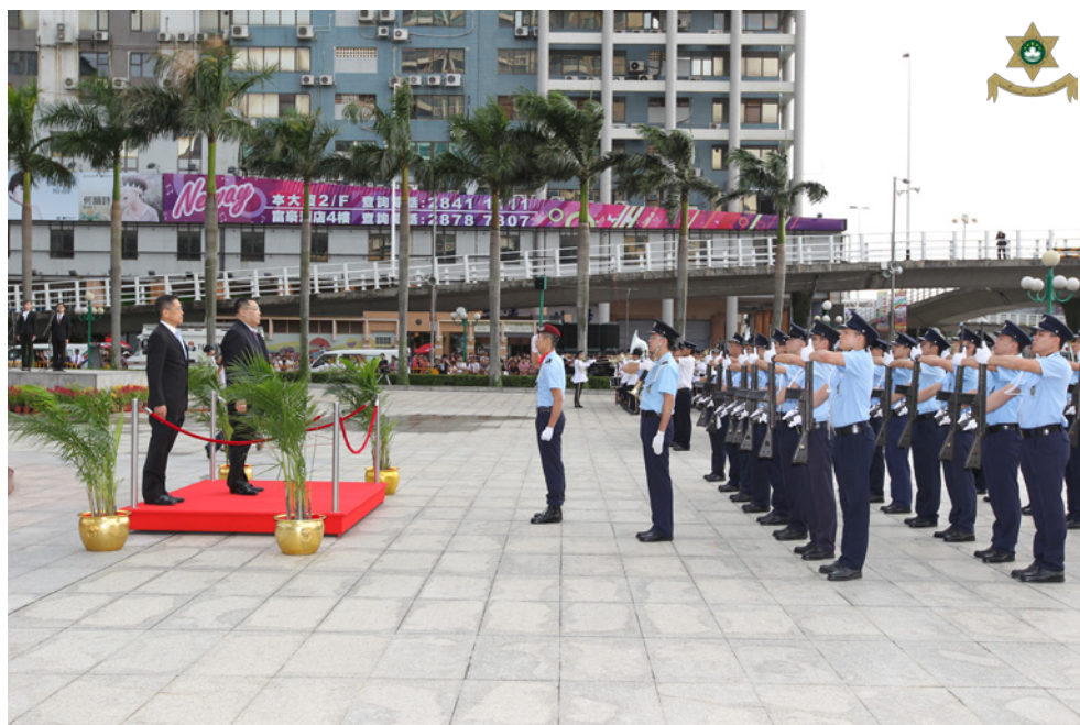
As Forças em Parada prestam continência ao Chefe do Executivo