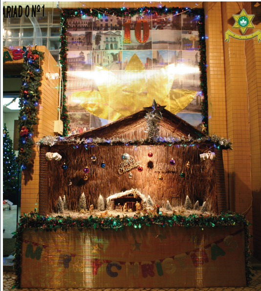
O presépio do Comissariado do n.º 1