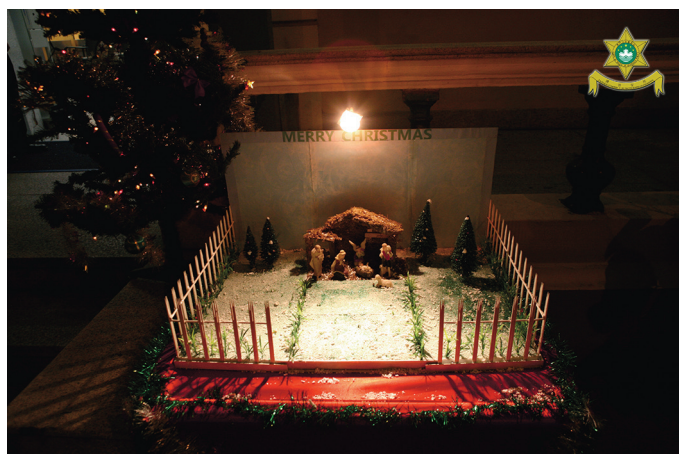
O presépio do Comissariado do n.º 2