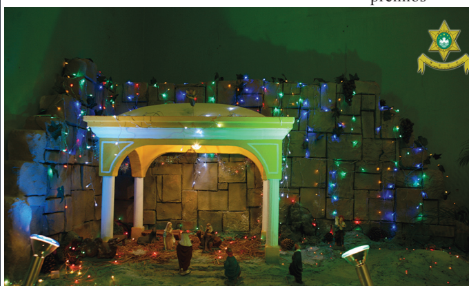
O presépio da UTIP