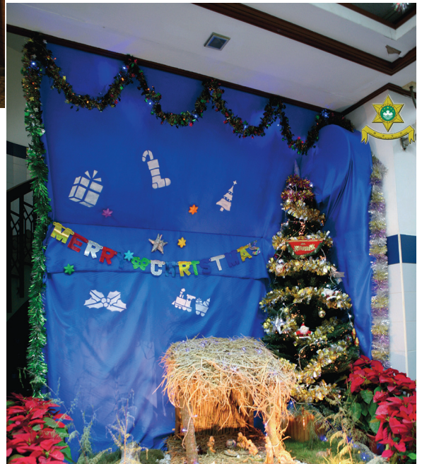
O presépio do Comissariado Policial da Taipa