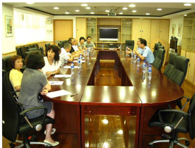
第三警務警司處代表與坊會代表交流意見