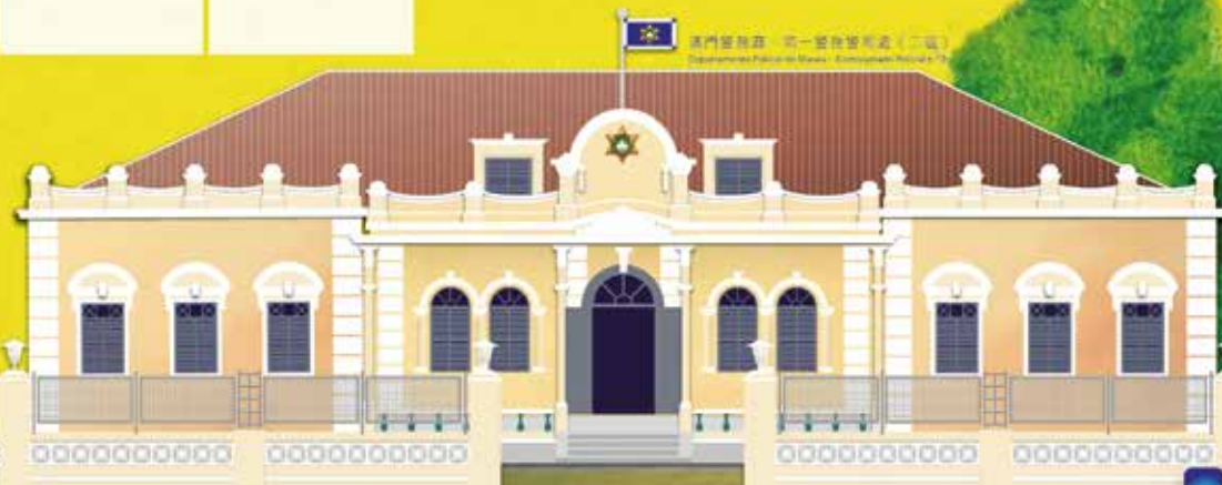
澳門警察局 - 第一警務署大樓 (二區) Departamento Policial de Segurança - Edifício Policial (2.ª Div.)

Não recear sacrifícios e assumir as missões com coragem