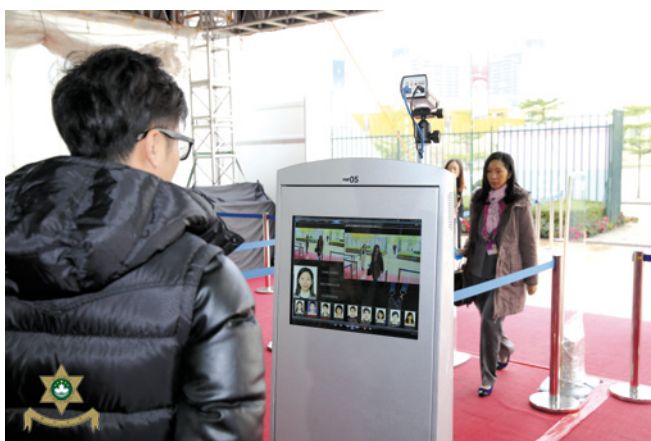
智能安保系統能迅速顯示與會者資料