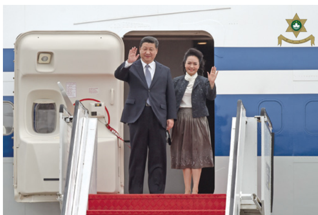
習近平主席伉儷抵澳（圖一）

2014年12月20日迎來了第十五個澳門回歸紀念日，榮幸地獲得國家領導人習近平主席親臨本澳，主持第四任行政長官就職儀式及主要官員監誓儀式。為此，本局採取了高級別的安保措施，事前全面評估及詳細計劃行動部署，協調各警務及消防部門，以確保國家領導、主要官員及嘉賓的人身安全和行程暢順；本局亦成立製證中心，編製各類智能通行證及車證，配合特警隊安檢組及各警務行動部門工作，所有進入之車輛和人士必須通過嚴謹的安檢步驟才能進入場館範圍。主席伉儷在訪澳期間亦探訪了居民住戶及教育機構，本局一絲不苟地執行沿途及場地安保、貼身保護之工作，確保道路暢通，全力保障各項活動安全無阻。