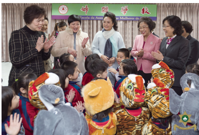
彭麗媛夫人參觀教育機構（圖三）