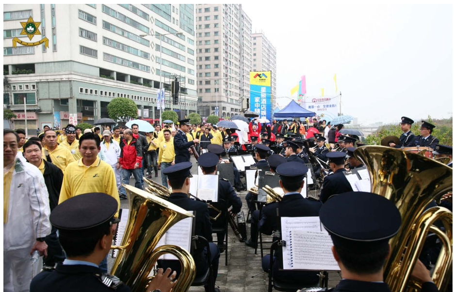
本局樂隊為慈善大軍落力演出