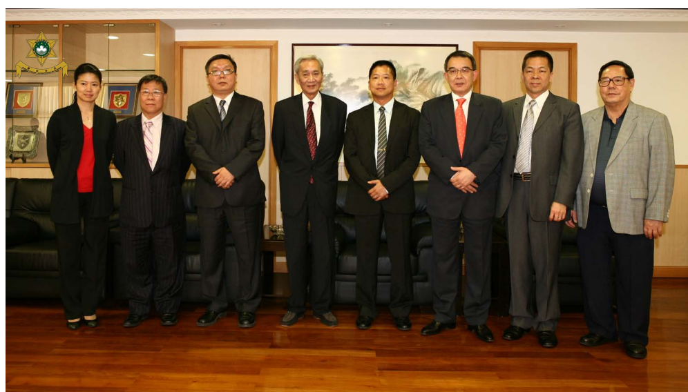
黎錦權副局長與劉會長一行人合照

12月12日，第廿七屆公益百萬行在孫逸仙大馬路起步，由行政長官崔世安先生及全國政協副主席何厚鏵先生等嘉賓主持起步儀式。本局隊伍在黎副局長帶領下，精神奕奕地隨逾四萬慈善大軍在微雨中浩浩蕩蕩向前進發。沿途上，本局警員負責維持秩序及指揮交通，警察樂隊則於指定地點演奏多首名曲，為慈善大軍打氣，現場愛心洋溢，歡欣熱鬧。