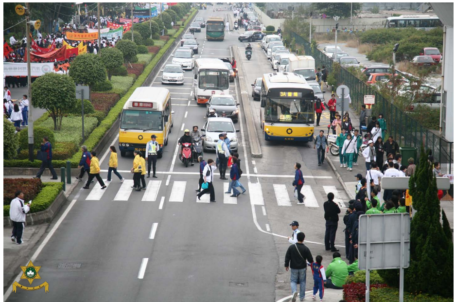
交通警察員在活動現場指揮交通