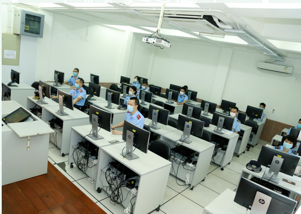
本校人員分批、分時段參與及瀏覽“國家安全走進校園”網絡圖片展

4月15日為全民國家安全教育日，“國家安全走進校園”網絡圖片展專題網站亦於當天開通。本校一向重視對學生的國家安全教育，塑造其自身對國家的責任感與使命感，於“國家安全走進校園”網絡圖片展啟動後，本校採取適當的防疫措施，連日來，本校領導主管、學生和教職員工分批、分時段瀏覽“國家安全走進校園”網絡圖片展，積極參與2020年全民國家安全教育日的活動。