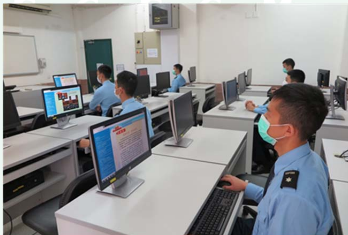
學生加深了對維護國家安全的責任感與使命感

透過多彩的圖片和簡潔的文字，加深本校教職員工和學生對當前國際關係和國家安全之間的了解，認清自身的義務與責任，提升人員維護國家安全和地區安全方面的使命感及責任感。