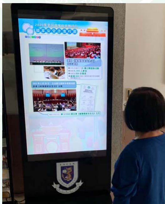
本校電子宣傳屏幕展示“國家安全走進校園”圖片內容