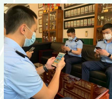
教職員工與學生也透過手機瀏覽網絡圖片展內容