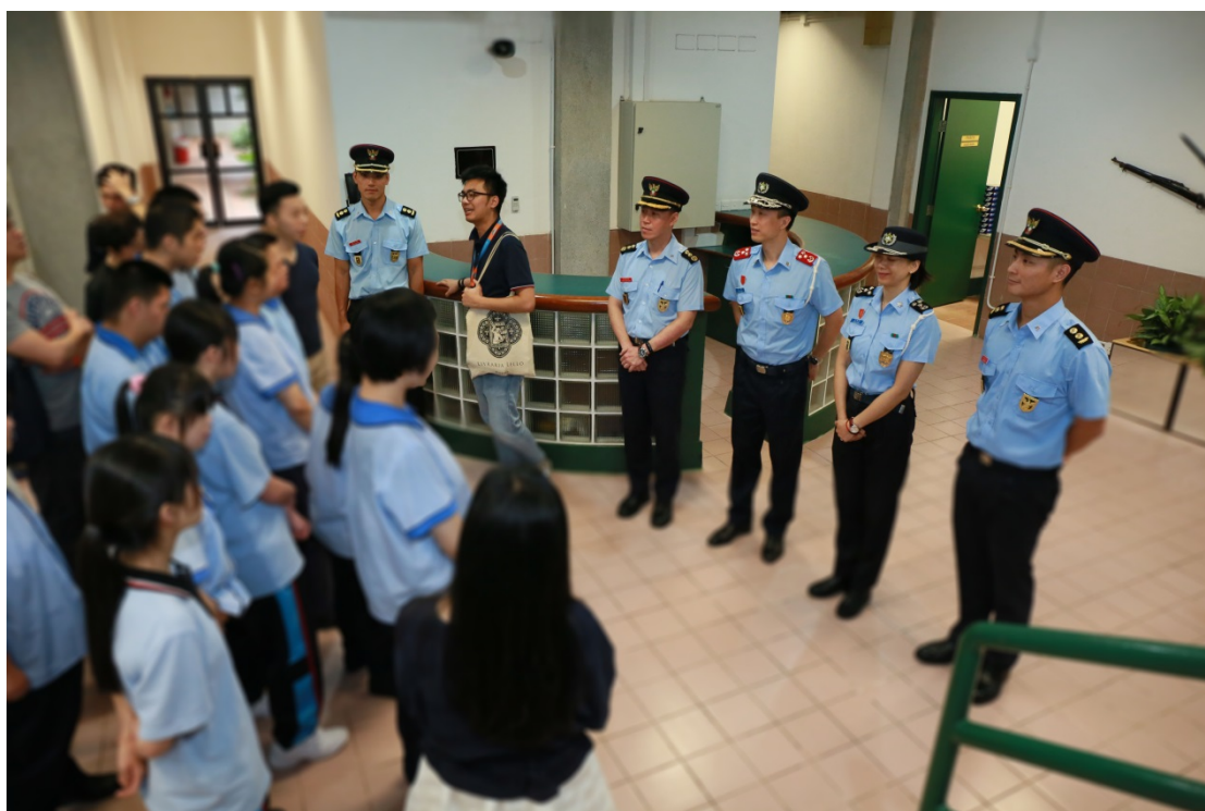
社工局代表向參與者講解有關避險中心的安排