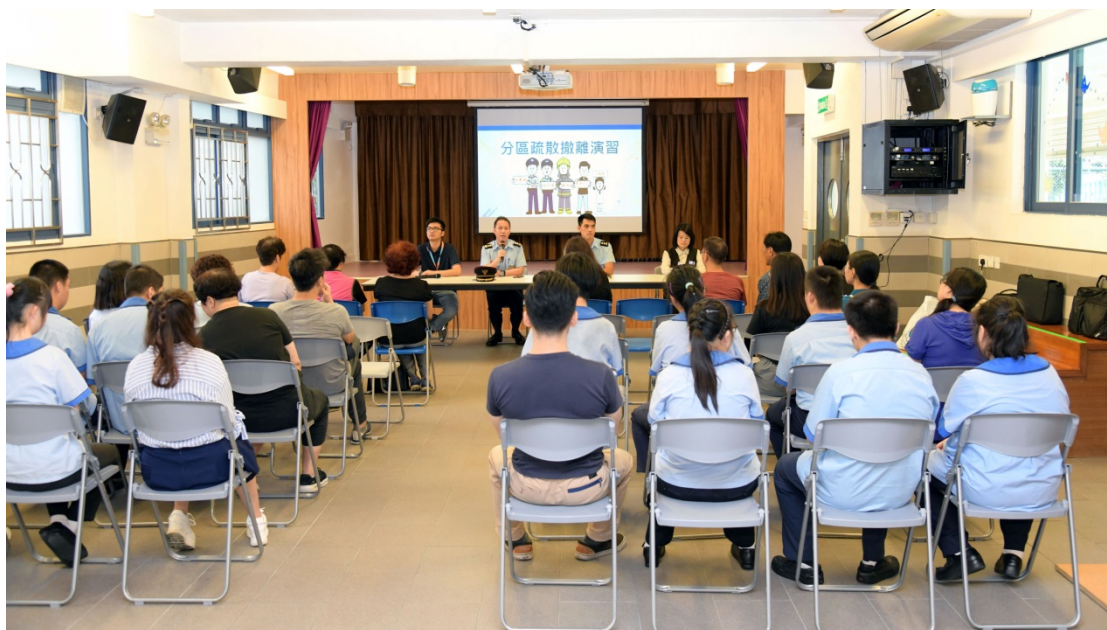
參與者細心聆聽部門代表的講解