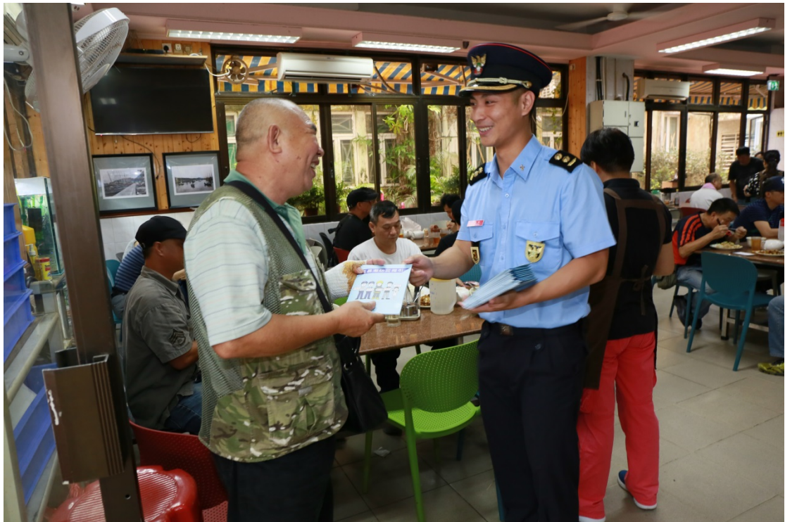
演習結束後保安高校人員開展社區宣傳活動