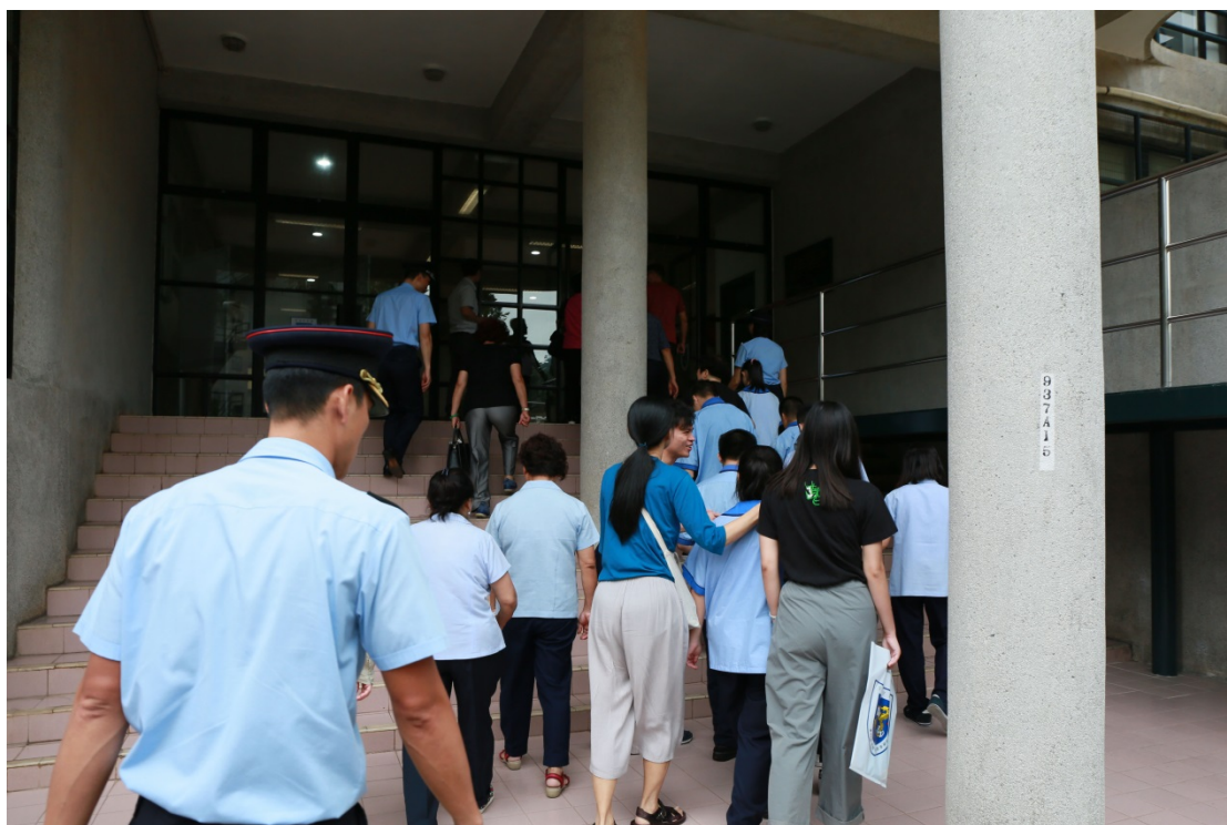
參與者進入避險中心