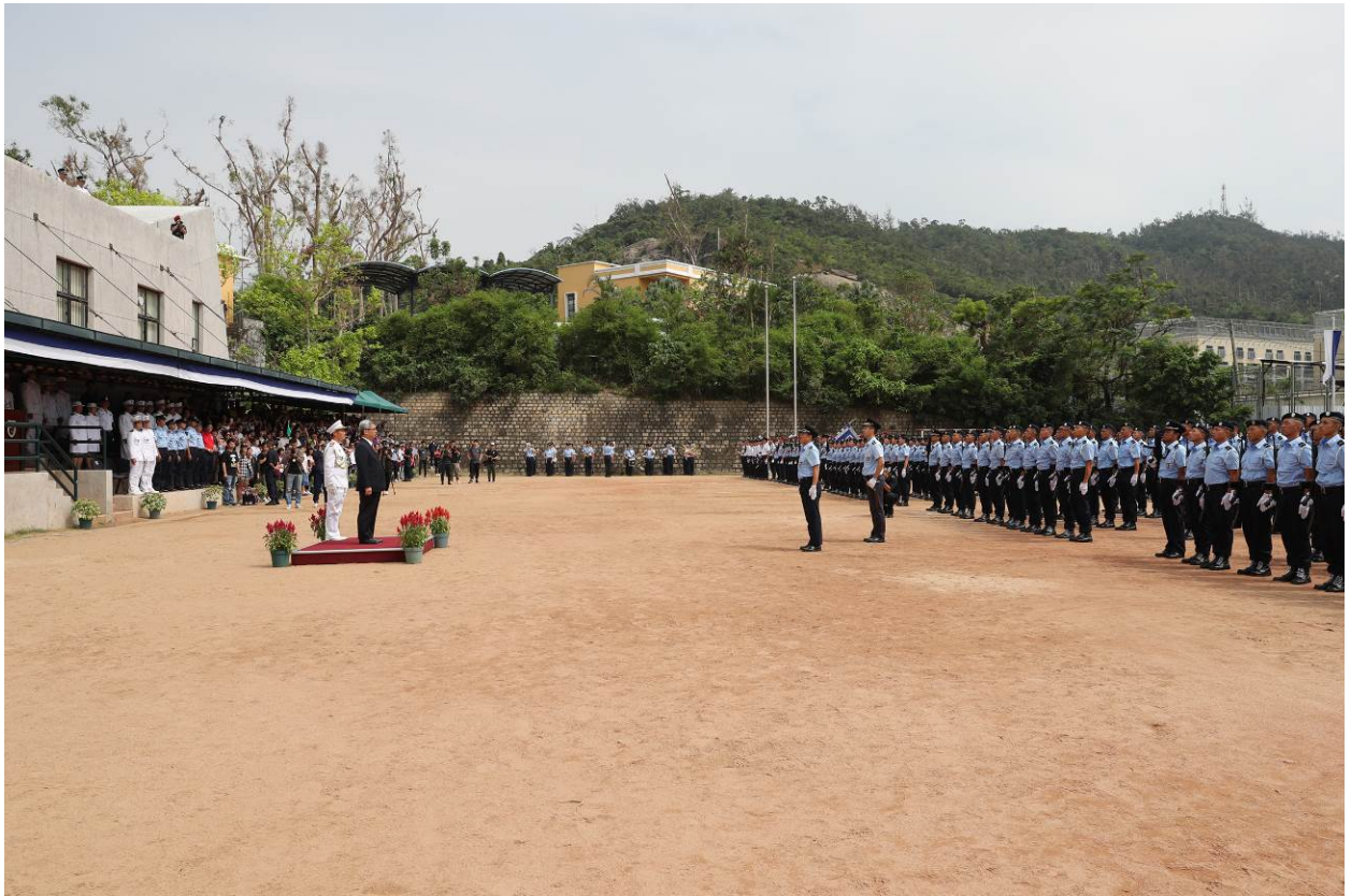
畢業學員向保安司司長敬禮