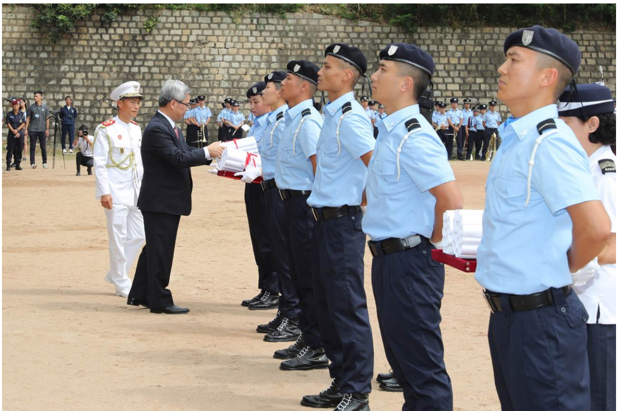
保安司司長向畢業學員頒發證書