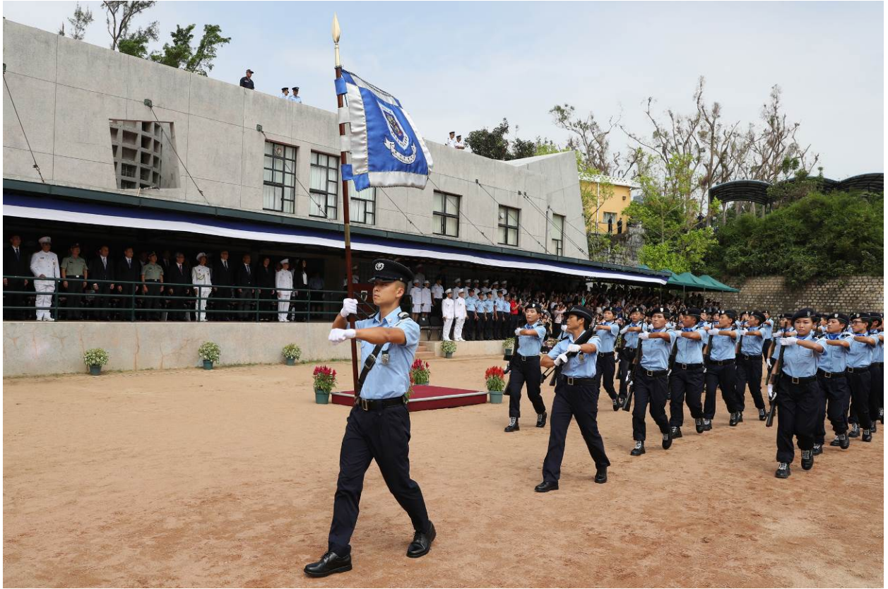
畢業學員步操向嘉賓敬禮