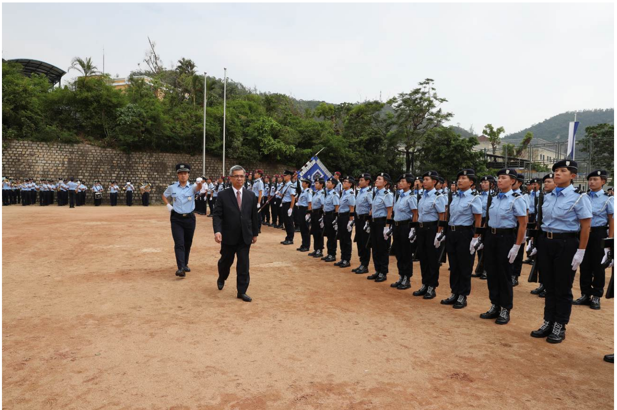
保安司司長檢閱隊伍