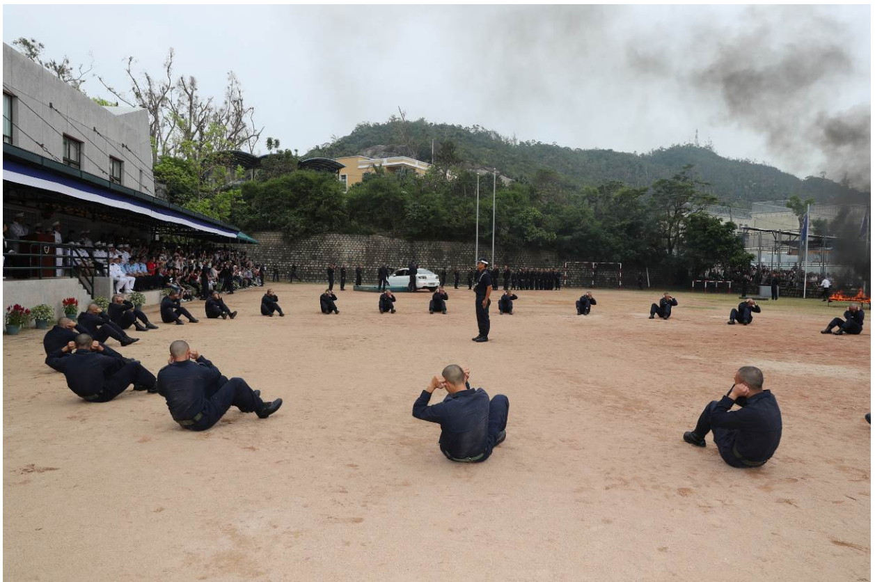
畢業學員進行軍事體育演練